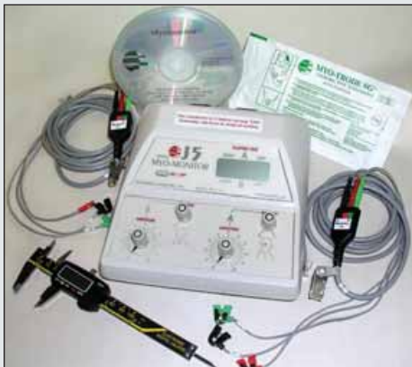
J5 Myo-monitor con accessori e DVD tutorial Myomonitor.